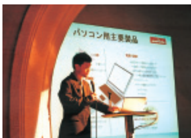
京都グリーン購入 ネットワーク誕生 イベント

村田製作所では、京都府内においてグリーン購入を広く普及するための推進組織として2004年11月に設立されたNPO法人「京都グリーン購入ネットワーク」に設立当初より入会しています。2005年3月に開催された京都グリーン購入ネットワーク誕生イベントでは、「(株)村田製作所の環境活動とグリーン購入・調達を紹介」と題して、ムラタの活動事例を発表しました。