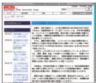
ホームページ (環境への取り組み)